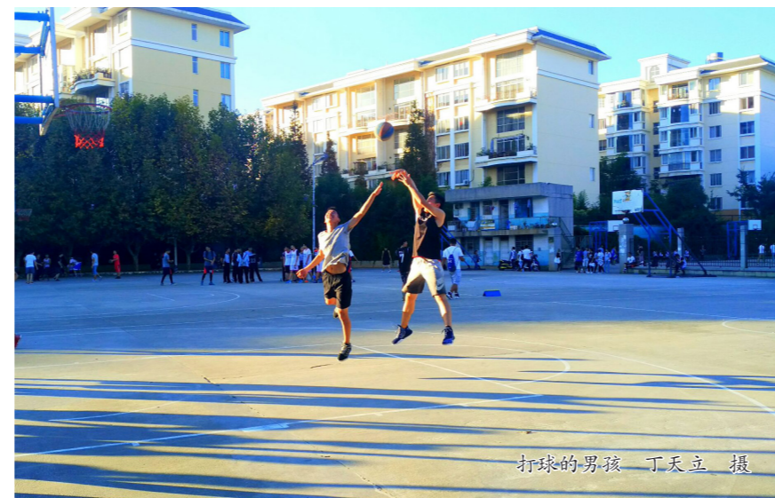
打球的男孩

这些曾支撑你走下去的零零散散，也支撑着我熬过漫长艰辛的高三。偶像的力量，大概就是如此吧，是让自己变得更好，让自己学习他的优点，一点点向他看齐。只有经历过