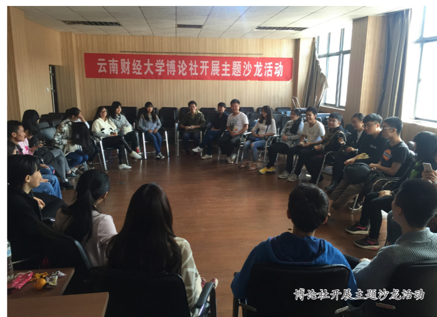
博论社开展主题沙龙活动